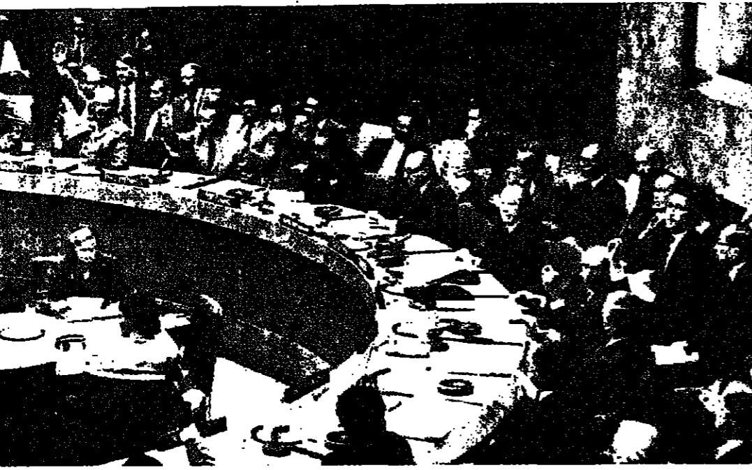
جلسة مجلس الأمن التي تقرر فيها دعوة العراق وايران لوقف القتال بينهما

وتطرق نائب الرئيس المصري ونائب رئيس الحزب الوطني الى اسرائيل بقولها ان ضم مدينتي القدس الشرقية يعتبر لافيا وباطلا . وقد اتهم الدكتور خليل اسرائيل بالتهاج موقفاً سلبياً ومنتزعة من المفاوضات حول الحكم الذاتي الذي وعدها الى الانتاج عن اقتدار اي عمل او اطلاق تصريحات البتة على مساعيها